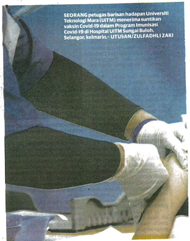
SEORANG petugas barisan hadapan Universiti Teknologi Mara (UITM) menerima suntikan vaksin Covid-19 dalam Program Imunisasi Covid-19 di Hospital UITM Sungai Buloh, Selangor, kelmarin.

Beliau menjelaskan, peranan hospital swasta akan dilibatkan pada fasa kedua Program Vaksinasi Covid-19 Kebangsaan iaitu membantu kerajaan menyediakan fasiliti dan petugas untuk vaksinasi.