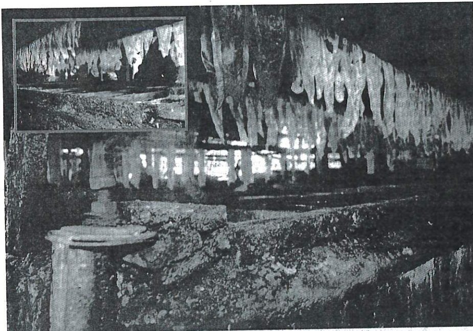
PREMIS memproses fucuk secara tradisional didapati tidak menjaga aspek kebersihan.