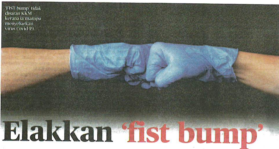
'Fist bump' tidak disaran KKM kerana ia mampu menyebarkan virus Covid-19.

AKHBAR : HARIAN METRO MUKA SURAT : 12 RUANGAN : LOKAL