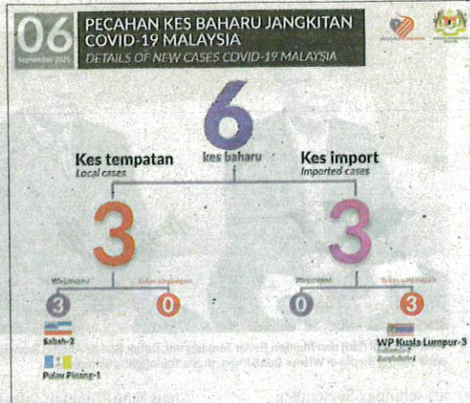
Pecahan kes baharu Covid-19 yang dicatatkan semalam.

"Sehingga kini, terdapat enam kes positif Covid-19 yang sedang dirawat di unit rawatan rapi (ICU) dengan tiga kes memerlukan bantuan pernafasan," katanya.