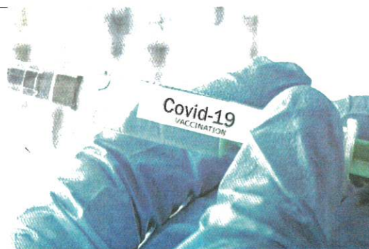
Vaksin COVID-19 bakal diberi percuma kepada rakyat dan penduduk Jordan.

Katanya, keadaan epidemiologi di Jordan masih serius dan memerlukan semua mematuhi langkah keselamatan serta pencegahan, terutama memakai pelitup muka dengan cara yang betul dan mematuhi penjarakan fizikal. BERNAMA