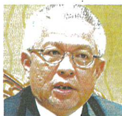
Dr Adham Baba

"Perkara ini juga sudah dibincangkan dalam sidang khas Majlis