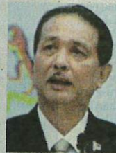
DR NOOR HISHAM

"Kriteria kes positif Covid-19 yang dipertimbangkan untuk pengasingan diri di tempat kediaman adalah tidak mengalami sebarang gejala atau mengalami gejala ringan, bukan