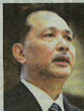
DR NOOR HISHAM

terdapat 10 kluster baharu dikenal pasti dengan enam daripadanya merupakan kluster tempat kerja serta kluster melibatkan majlis hari keluarga dan sejarah rentas negeri dari Selangor.